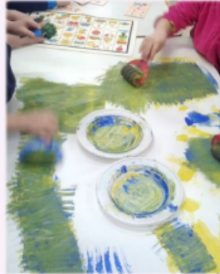
Παράδειγμα 22. Τα χρώματα

Η νηπιαγωγός παρατηρεί τον ενθουσιασμό των παιδιών όταν βλέπουν το ουράνιο τόξο την ώρα του διαλείμματος. Όταν μπαίνουν στην τάξη τους δίνει μαρκαδόρους και χαρτί για να το ζωγραφίσουν. Παρατηρεί ότι πολλά παιδιά συζητούν μεταξύ τους για τα χρώματα του ουράνιου τόξου. Τις επόμενες μέρες σχεδιάζει οργανωμένες δραστηριότητες για τα χρώματα.