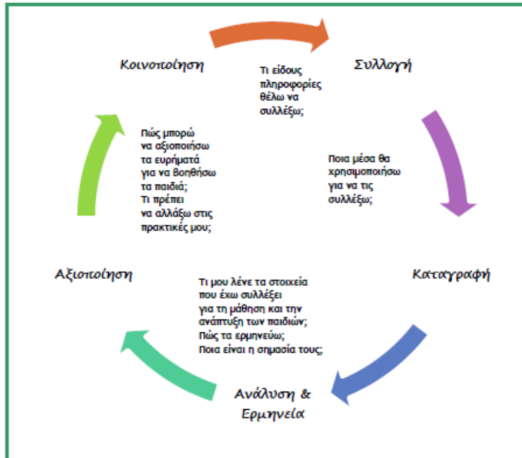
Σχήμα 1. Τα στάδια της αξιολόγησης